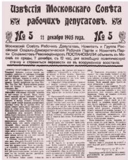
Газета Московского совета, Декабрь 1905 г.

Московский совет сумел накопить значительные силы. В ответ на расправы властей с забастовщиками 9 декабря в городе началось вооруженное восстание. Дружины повстанцев использовали тактику партизанской борьбы. Полицию и казаков обстреливали с крыш, чердаков, из-за заборов, из толпы. Строились баррикады, которые войскам приходилось брать штурмом. Бои в Москве продолжались более недели. Лишь прибытие из Петербурга Семеновского полка позволило подавить последний очаг восстания в районе Пресни. 19 декабря 1905 г. по решению Московского совета вооруженная борьба была прекращена. В ходе боев и дальнейших расправ погибли тысячи человек.