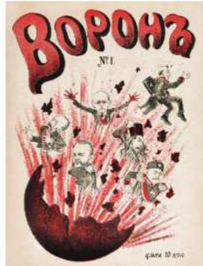
Царское правительство взлетает на воздух. Обложка оппозиционного журнала «Ворон», 1905 г.

► Октябрьская стачка и Манифест 17 октября. Забастовки и стачки не прекращались. Часто уличные шествия перерастали в стычки с полицией.