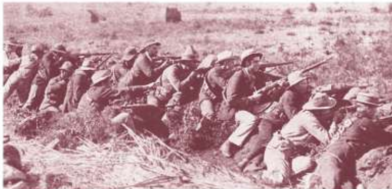
Бурские солдаты в обороне. 1900 г.

В 1898 г. США напали на Испанию под лозунгом освобождения ее колоний. В результате формальную незави-