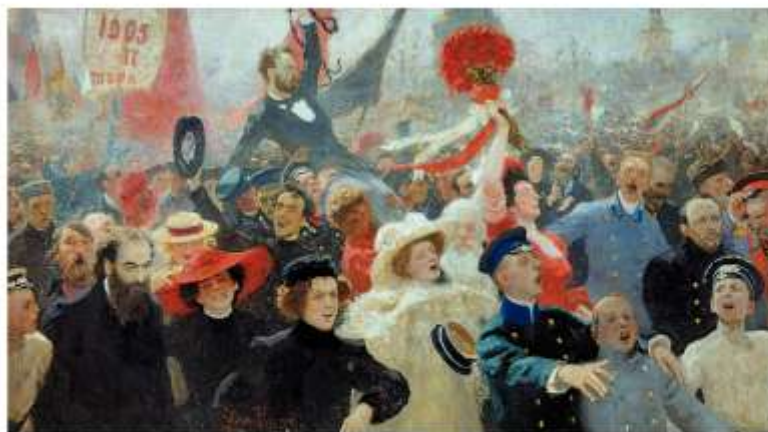
Манифест 17 октября 1905 г. Художник И. Е. Репин

В первые дни после принятия Манифеста во многих городах прошли демонстрации. Одни манифестанты шли с национальными флагами и царскими портретами, приветствуя дарование свобод. Другие рвали эти портреты и, шагая по городским улицам с красными флагами, призыва-