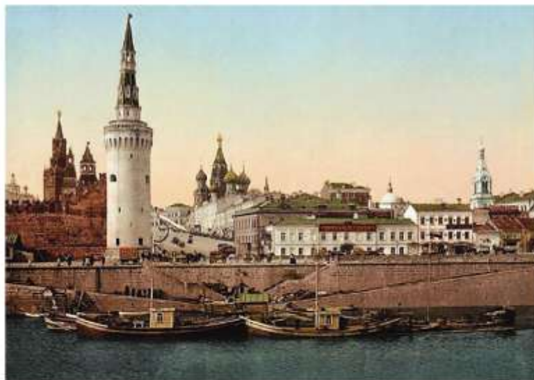
Москва начала XX в.

В 1903 г. окончательно организационно оформилась Российская социал-демократическая рабочая партия (РСДРП) . Социал-демократы, опираясь на учение К. Маркса, считали главной силой будущей революции рабочий