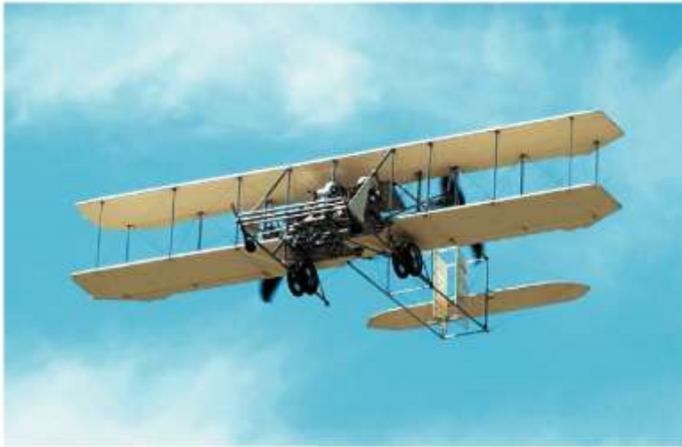
Один из первых самолетов

же быстрый рост ее научно-технической основы. Наибольшее значение имели электрификация промышленных предприятий и транспорта, начало автоматизации, использование двигателей внутреннего сгорания, совершенствование химических технологий.